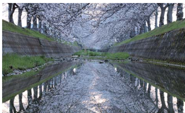
稲美町 曇川の桜並木