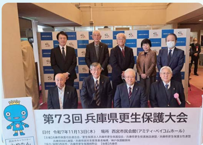
令和7年11月13日(木) 西宮市民会館にて