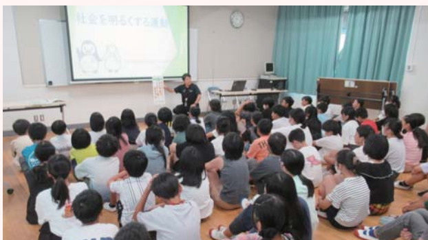
播磨小学校6年生（担任の先生も協力）